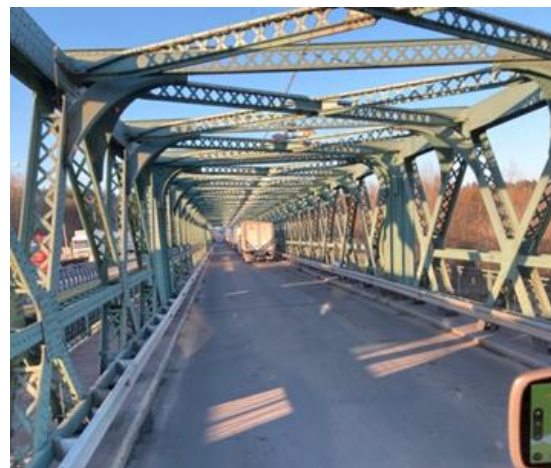
Grens passage Polen-Oekraïne