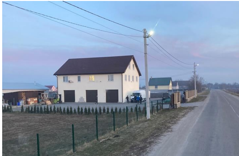
Het depot van Friedensstimme Duitsland in Romashky

Het vierde wat ons overkwam was wel even heftig.