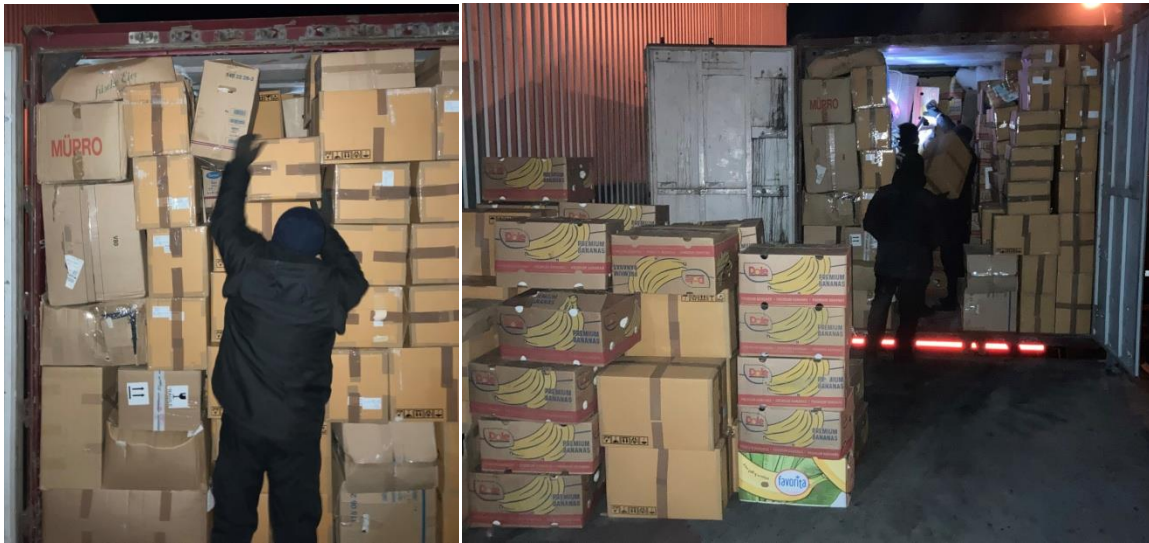
De controle gebeurt grondig

Ze nemen behoorlijk wat foto's die ze gelijk doorsturen naar hun superieuren. De leidende douane man komt naar me toe en hij zegt: 'Ik ben heel erg blij voor jullie en voor ons. Ik ben ook een christen en ik weet dat wij deze Bijbels hard nodig hebben. Maar weet je, ik heb ook de opdracht van mijn baas uit te voeren om jullie te controleren. Er zijn ook veel humanitaire vrachten waarmee ze van alles smokkelen wat niet op de papieren staat. Gelukkig klopt bij jullie alles'. Nogmaals vraagt hij ons: 'Heb je chocolade bij je'? Ik zeg: 'ja, in de cabine'. Nu als je wilt zegt hij, geef dan die werkmensen wat chocolade voor hun arbeid. We krijgen de benodigde stempels op de documenten en kunnen dan na 13 uren de grens passeren en zijn we in de Oekraïne aangekomen.