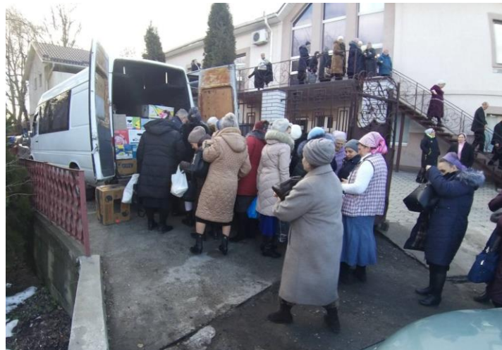
We hebben de weduwen ondersteunt door het geven van een voedselpakket

Hierop ontvingen wij de volgende reactie: