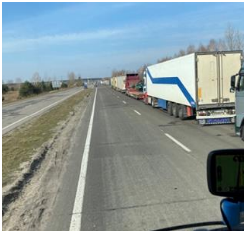
Lange rij voor de grens.