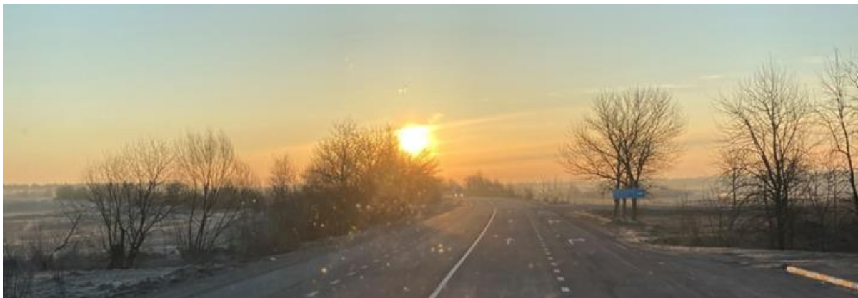
Vanwaar de zon in het Oosten straalt Psalm 113 : 2 berijmd

Ze nemen behoorlijk wat foto's die ze gelijk doorsturen naar hun superieuren. De leidende douane man komt naar me toe en hij zegt: 'Ik ben heel erg blij voor jullie en voor ons. Ik ben ook een christen en ik weet dat wij deze Bijbels hard nodig hebben. Maar weet je, ik heb ook de opdracht van mijn baas uit te voeren om jullie te controleren. Er zijn ook veel humanitaire vrachten waarmee ze van alles smokkelen wat niet op de papieren staat. Gelukkig klopt bij jullie alles'. Nogmaals vraagt hij ons: 'Heb je chocolade bij je'? Ik zeg: 'ja, in de cabine'. Nu als je wilt zegt hij, geef dan die werkmensen wat chocolade voor hun arbeid. We krijgen de benodigde stempels op de documenten en kunnen dan na 13 uren de grens passeren en zijn we in de Oekraïne aangekomen.