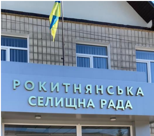
Het gemeentehuis van het Rokytno Rayon