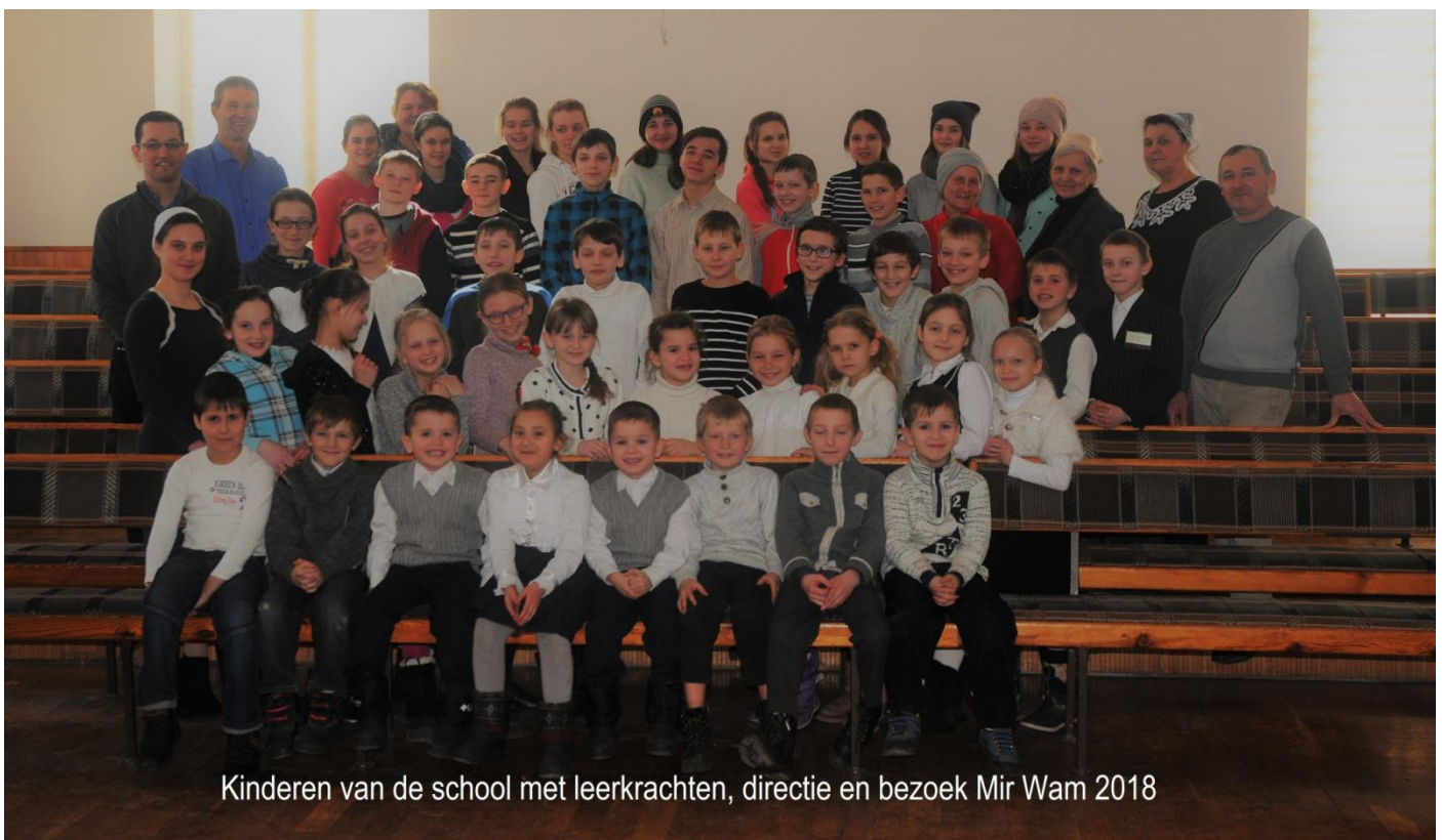
Kinderen van de school met leerkrachten, directie en bezoek Mir Wam 2018