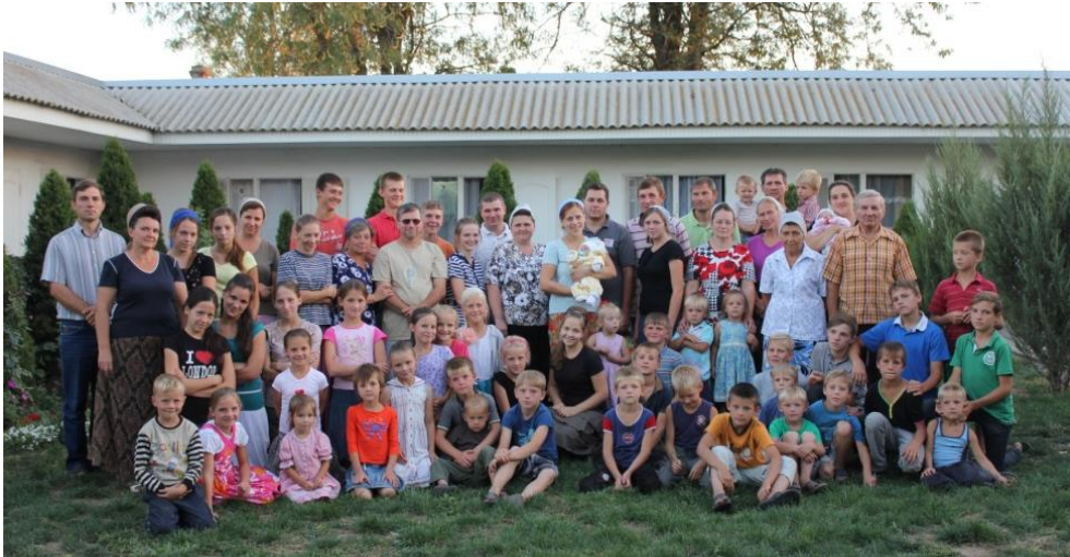
Foto uit het vluchtelingenkamp.

Mijn familie en enige andere families uit Horlivka, Donetsk en Lugansk kwamen in een vluchtelingenkamp terecht in de buurt van Melitopol. Onze geloofsbroeders hadden dit liefdevol ingericht. Elke dag wachten wij op het einde van de oorlog om terug te kunnen keren naar ons eigen huis. In dit kamp hebben we duidelijk Gods liefde en de liefde van onze gelovige broeders en zusters gezien. Uit verschillende landen zijn ze gekomen om ons te helpen en te ondersteunen. Drie maanden lang hadden wij verder niets nodig. Moge de Heere onze vrienden, voor deze zorg, rijkelijk belonen.