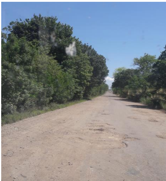
Kapot wegdek wordt hersteld

Voor alle genoemde data geldt: DV, Zo de Heere wil en wij leven zullen