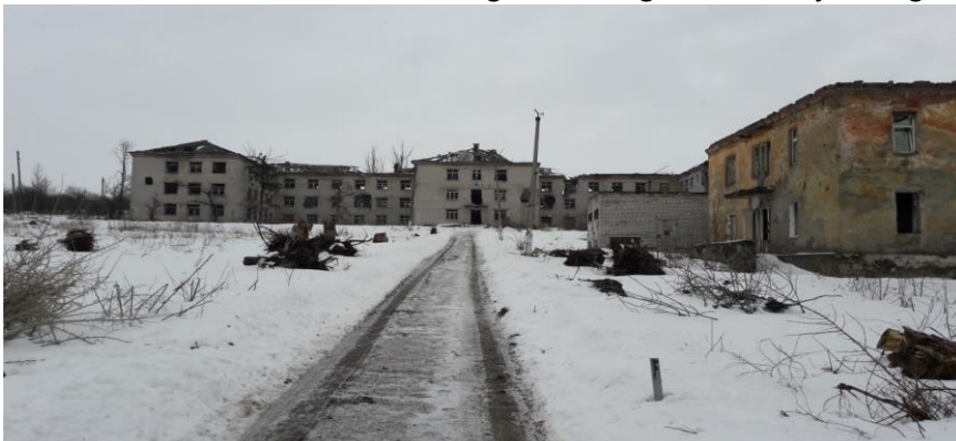
Een kapot geschoten ziekenhuis.

Wij waren blij dat we iets konden zeggen tegen onze dove medemensen. En toen kwam de oorlog. Onze kinderen moesten ervaren hoe mortiergranaten explodeerden, hoe raketagelwerpers schieten en hoe vliegtuigen hun dodelijke lading lieten vallen. Toen het zeer gevaarlijk werd deze kanonnade te verdragen werd in onze gemeente besloten, dat families met kinderen de gevechtszone tijdelijk moesten verlaten. Helaas is de oorlog in onze regio nu na zes jaar nog steeds niet beëindigd.