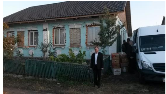
Het aangekochte huis

We willen alle broeders en zusters hartelijk bedanken die in onze persoonlijke noden maar zeker in de noden en behoeften van onze dove en slechthorende broeders en zusters ons willen helpen.