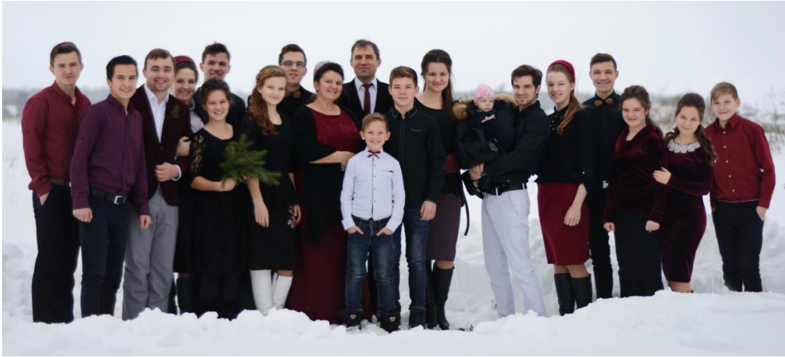
Familie Zigankov met 2 aangetrouwde en 1 klein kind

In 2000 verhuisden we naar Horlivka ook regio Donetsk waar ik in 2010 tot diaken ben ingewijd.